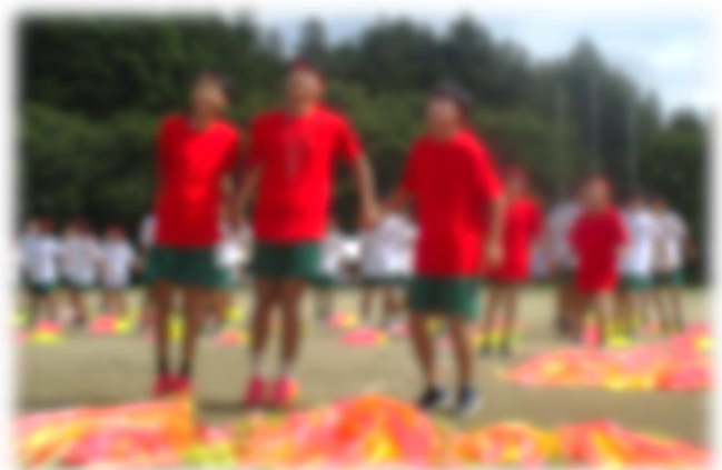
<選抜リレー：選手入場>