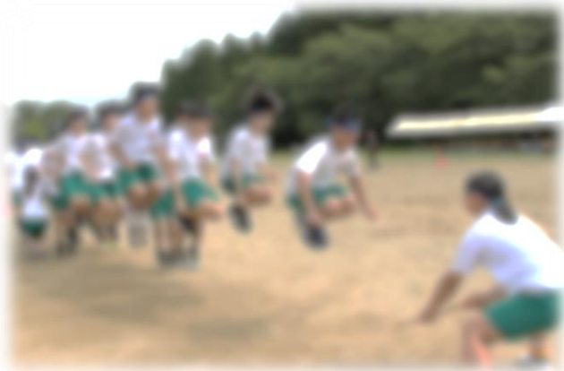
<生徒会種目：大縄跳び>